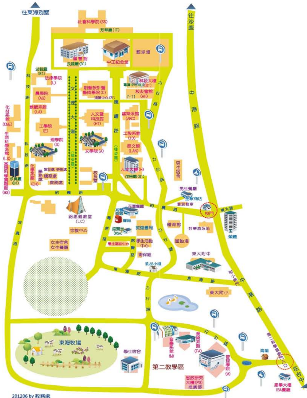
201206 by 教務處