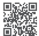
TronClass App 下載